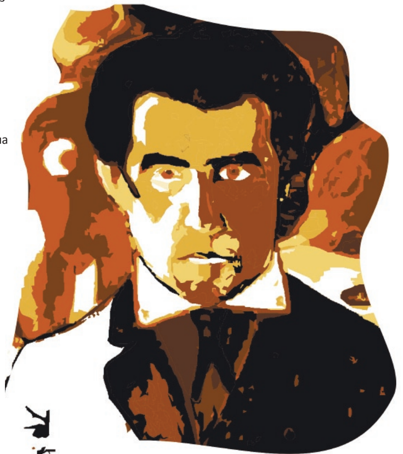
Казимир Малевич (1879 - 1935)

Скончался Казимир в 1935 году в Ленинграде. Однако его смерть по сути ничего не значила – имя Малевича стало символом появления чего-то нового, смелого и бескомпромиссного. Явления, вектор которых направлен сугубо в будущее. Малевич – это пример для сообщества Забей, потому что, такие как он, смелые и неповторимые, оставляют не просто след в Истории, а пишут ее целые страницы и тома.