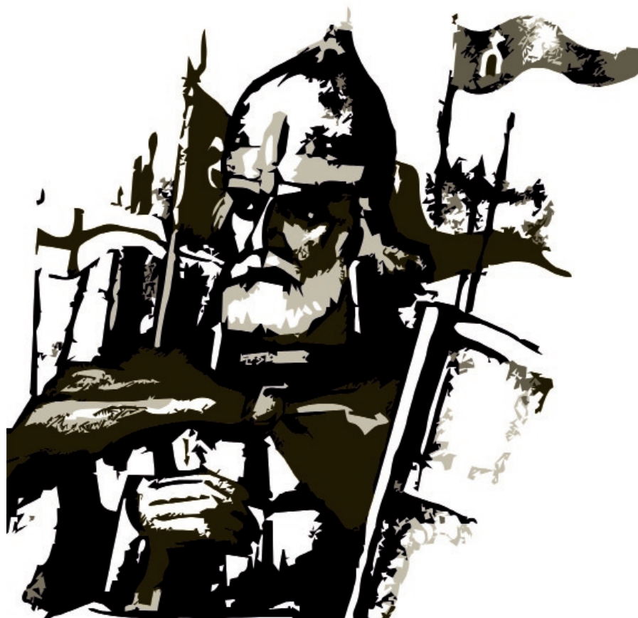
Давыд Городенский (1283-1326)

Он рождает в наших сердцах гордость за то, что в нашей Истории есть такие герои. Турнир Пассионариев посвящён именно таким людям!