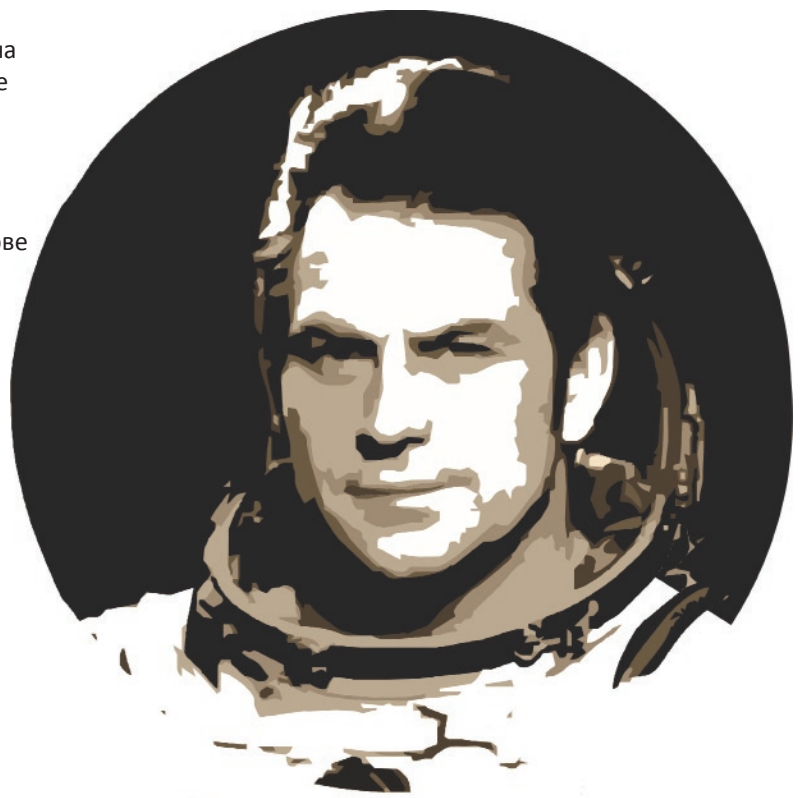
Владимир Коваленок (1942 - ...)

Сообщество Забей хочет достигать целей и показывает Турниром Пассионариев примеры Истории!