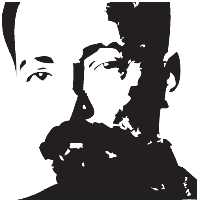
Феликс Дзержинский (1877 - 1926)

Нам важен факт, что Феликс Дзержинский - это пассионарий, который боролся за свои идеалы смело, настойчиво, героически.