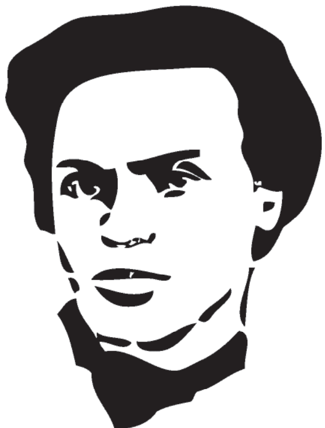
Константин Калиновский (1838-1864)

Итак, Константин Калиновский – революционер, публицист, превосходный организатор. Сообщество Забей берёт пример с деятельности Калиновского-пассионария.