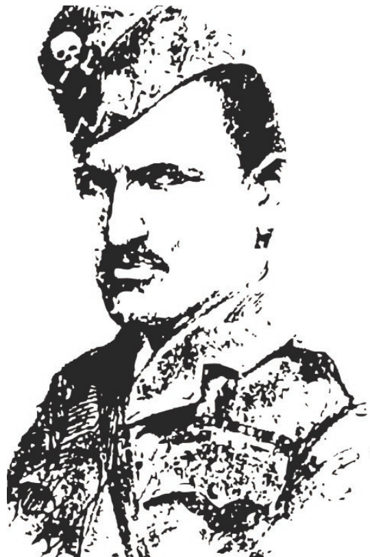
Станислав Балахович (1883—1940)

Балаховичу удалось реализовать себя не столько военным, слепо служащим разным хозяевам, сколько политиком, самостоятельным игроком, который вписал своё имя в историю. Для сообщества Забей путь этого человека пример того, что история не знает тупиков. Балахович их «не знал» - он действовал.