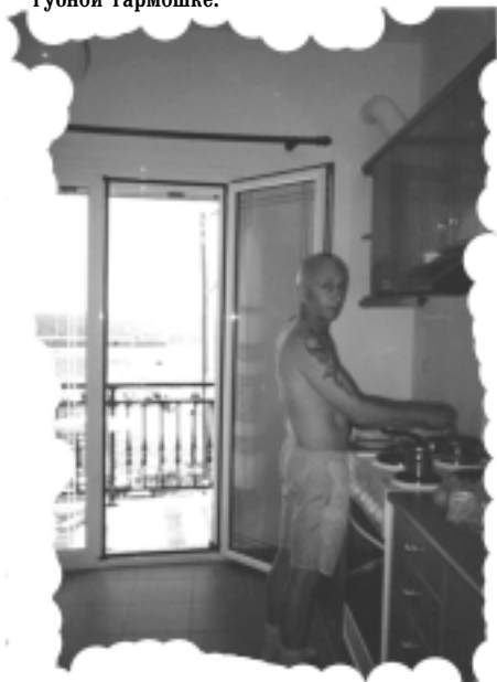
Милованман готовит бекон с видом на Эгейское море.

Правительство берет у них уроки игры на губной гармошке.