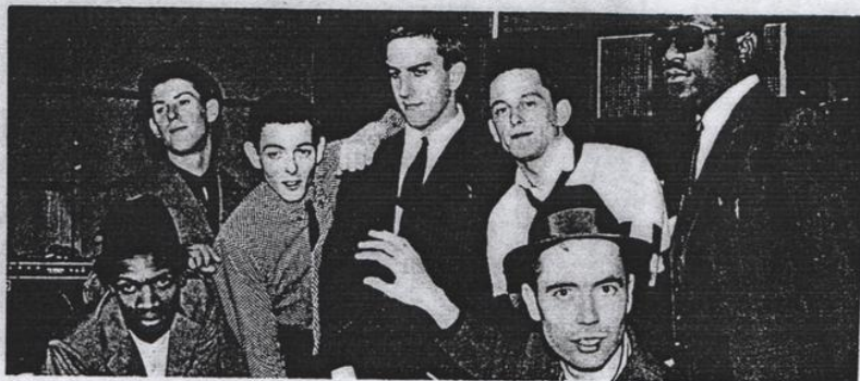
The Specials: Two-Tone's biggest of cheeses.

Тем не менее, начиная со своего второго альбома "More Specials" (Two Tone LP/CD, CHRTT/CCD 5003), группа начала уходить от своих ска-корней. Тематическая песня "Ghost Town", в качестве сингла занявшая 1-е место в charts, в то время как уличные бои сотрясали провинциальные города Британии, была ближе к ресторанной музыке, чем к блюзовому бопу для танцев на party.