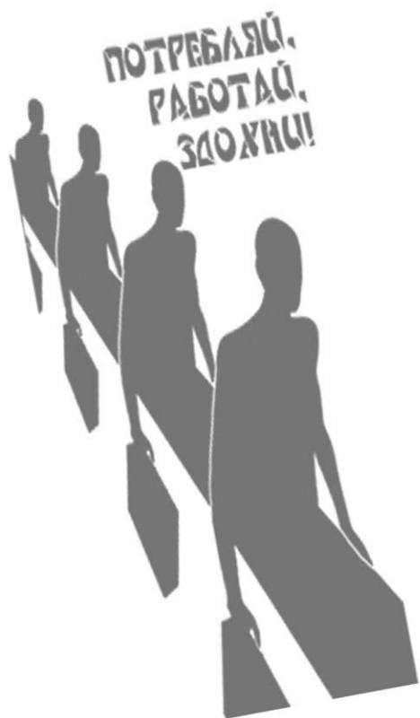
панк-зин "С нуля!" №2

Продавая свое время, продавая время своей жизни, ты, конечно, сможешь выменивать его на бесконечный «прогресс» и моду, выменивать свою жизнь на косметику, тряпки и телефон с видеокамерой. Единственное, чего ты не сможешь купить и вернуть обратно – это время, которое ты УБИЛ на работе, оплачивая все эти капризы общественного мнения.